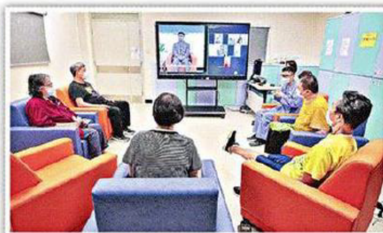
■東區醫院精神科延續疫下的視像訓練。

【本報訊】新冠疫情除了改變港人生活習慣，亦推動醫院服務電子化。東區尤德夫人那打素醫院精神科自2020年8月展開先導計劃，提供日間視像訓練予成人及老人精神科病人，視像訓練於疫後恒常化，並加入照顧者訓練等，方便難以親身到醫院的病人，其後亦試行使用醫院管理局應用程式「HA Go」進行訓練。該院稱至今已有逾40%成年、兒童及青少年患者等曾參與視像訓練。有照顧者指視像訓練令她能善用時間，病人亦能夠「安安樂樂」在家中上課。