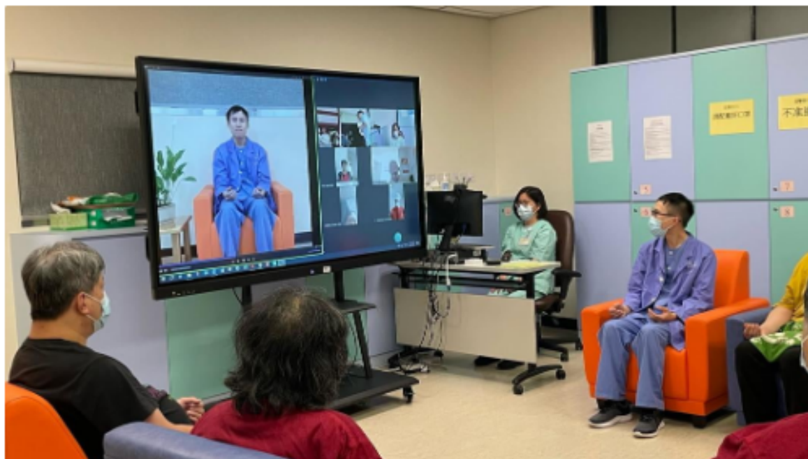
東區醫院冀將視像訓練服務恆常化 林瑞庭攝